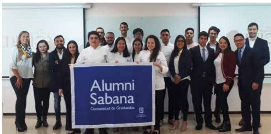
Graduados y estudiantes de los últimos semestres de Gastronomía y Administración & Servicio participaron en el plan de carrera Placement International.

El 2 de agosto, graduados y estudiantes de los últimos semestres de Gastronomía y Administración & Servicio participaron en el plan de carrera Placement International , programa que ofrece pasantías y experiencias profesionales en los mejores hoteles del mundo.