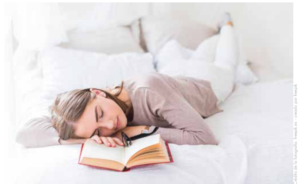
Del 7% al 25% de los adolescentes presentan síntomas como cansancio permanente, agotamiento, somnolencia excesiva y fatiga, debido a malos hábitos de sueño.

Según la investigación, no tener una buena higiene del sueño puede producir "problemas de memoria, déficit de atención, problemas de comportamiento, bajo rendimiento académico y alteraciones en el