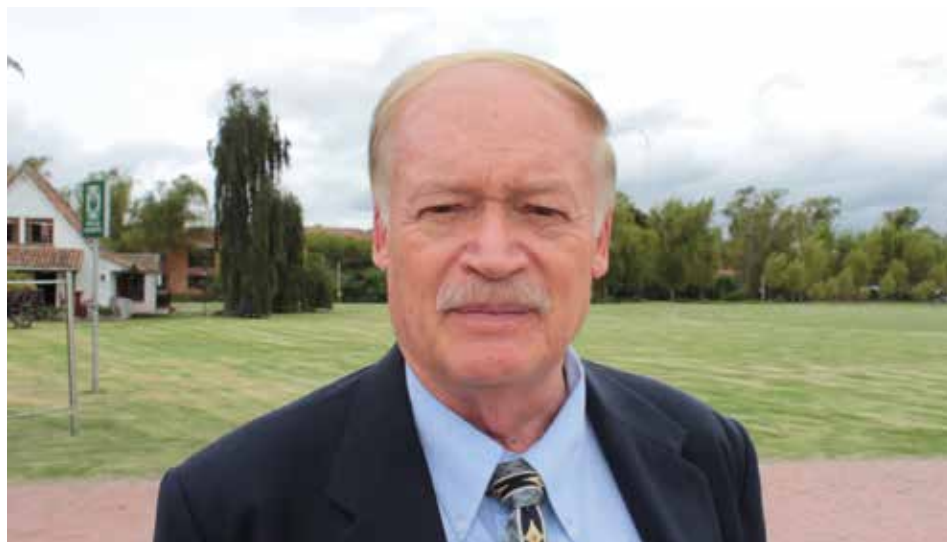
El doctor Ángel Díaz Barriga Casales, investigador emérito de la Universidad Nacional Autónoma de México.

En el evento, los asistentes conocieron la diferencia entre la educación tradicional y la didáctica. El conferencista enfatizó en el papel que cumple el profesor al momento de asignar una labor o un trabajo: “El aprendizaje está basado en problemas. Al profesor le corresponde ir orientando al estudiante para que él resuelva el problema, siempre teniendo en cuenta que la escuela