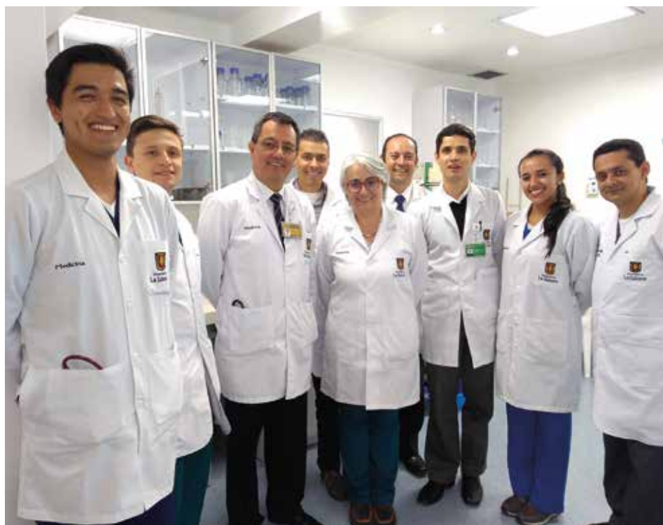
El grupo de investigación y residentes de Farmacología de la Clínica.

Los nanobiosensores son dispositivos que permiten evaluar interacciones moleculares en tiempo real y brindan resultados. Son usados en la vida diaria; por ejemplo: en el glucómetro una gota de sangre interacciona con una enzima contenida en la tirilla. Al insertarla en el dispositivo, los nanobiosensores obtienen los resultados en tiempo real sin