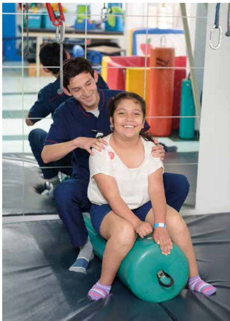
La Clínica Universidad de La Sabana es la primera institución acreditada internacionalmente con la excelencia en rehabilitación.

Los testimonios de los pacientes y sus familiares acerca del proceso reflejan los resultados favorables en sus tratamientos, en conformidad con el trabajo en equipo del paciente, sus cuidadores y familias, y el equipo médico-terapéutico.