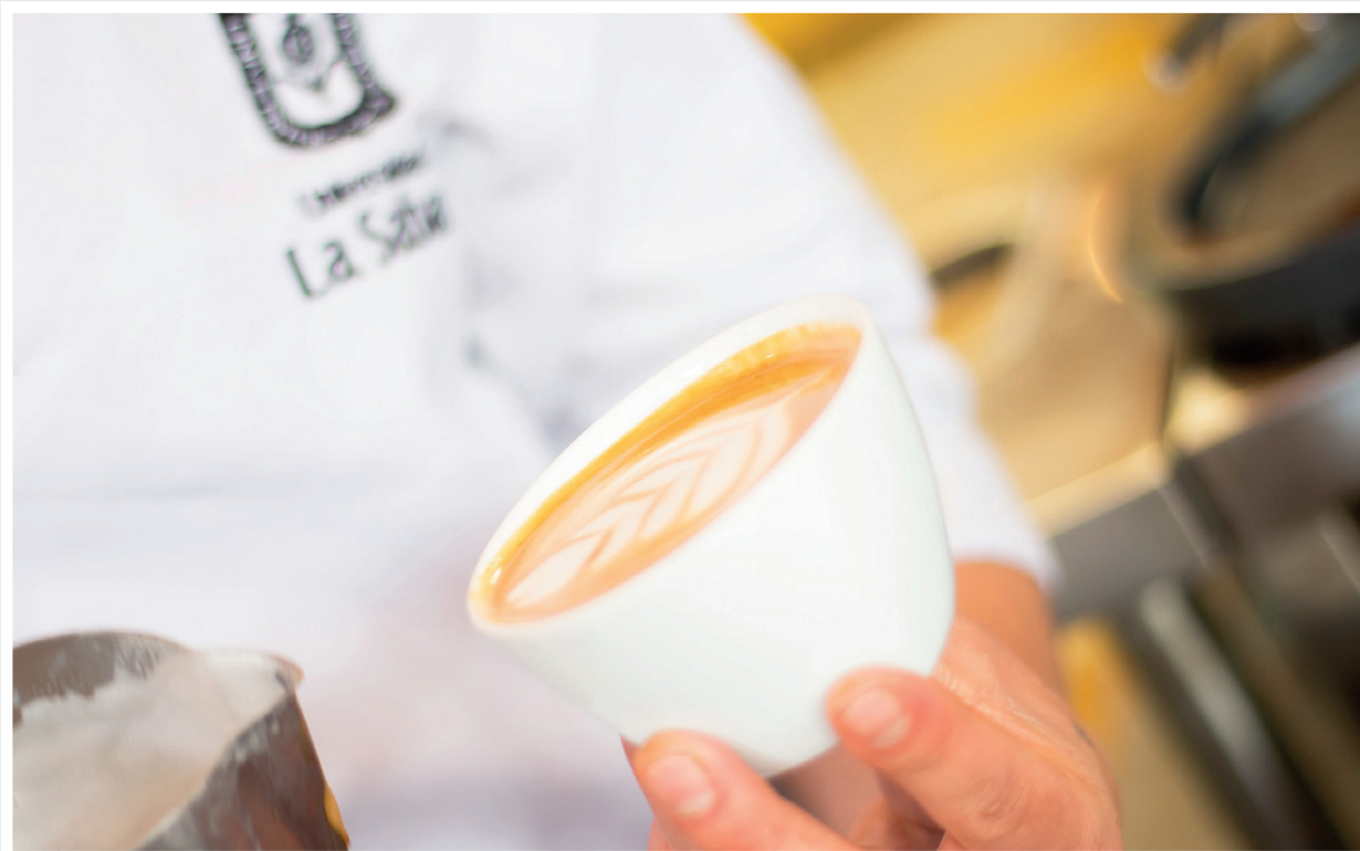
En La Sabana se ofrecen productos desarrollados exclusivamente para satisfacer todos los gustos que hay en la comunidad universitaria.

El único punto donde se consigue una preparación diferente es en el Café del L (Edificio L, primer piso), el cual es una mezcla 100% arábica colombiana.