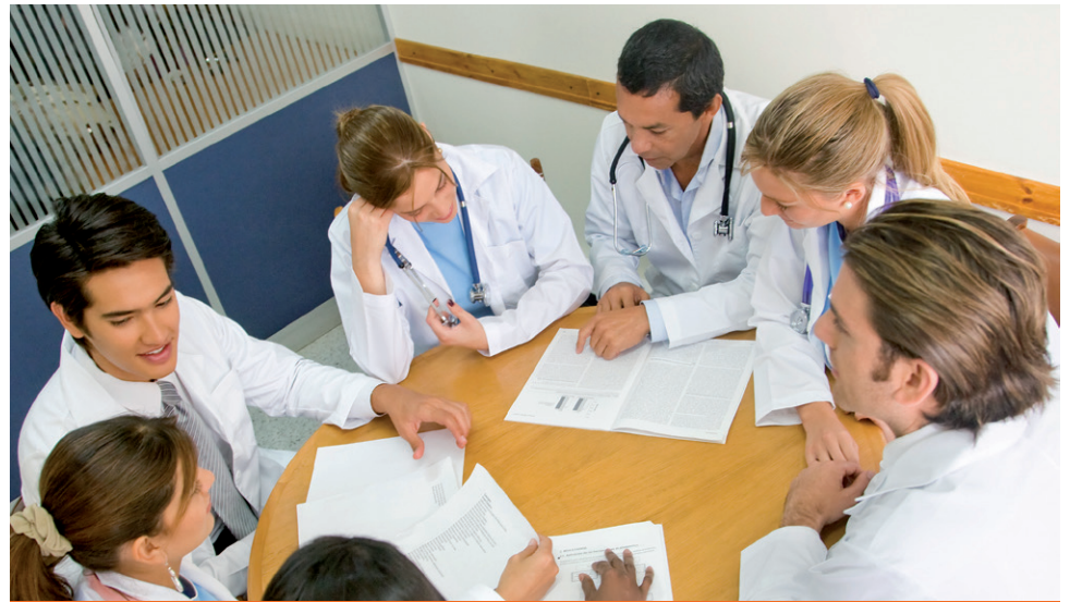
La Clínica Palermo, ubicada en la zona centro de Bogotá, recibirá a los estudiantes de los programas de salud.

Por otro lado, el 14 de febrero se inauguró en la Clínica Palermo un área de bienestar para los estudiantes, con espacios para el estudio, el descanso y las revisiones de temas. Este espacio fue construido con el apoyo de la Universidad de La Sabana.