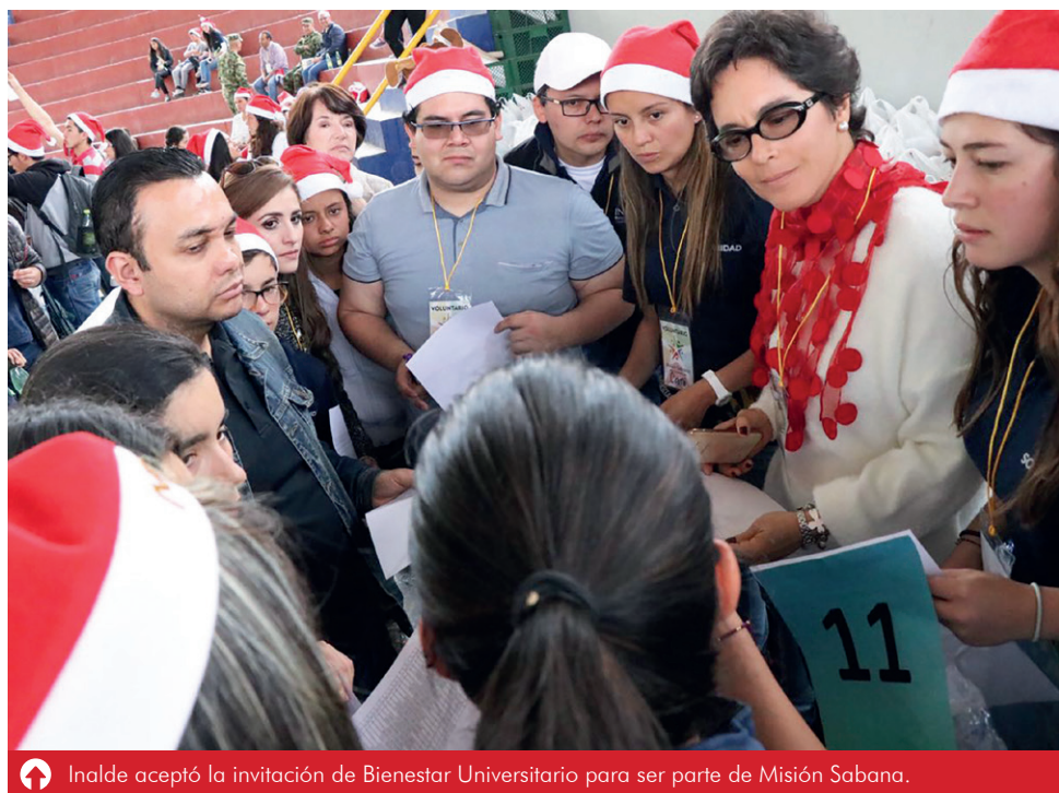
Inalde aceptó la invitación de Bienestar Universitario para ser parte de Misión Sabana.

Los proyectos con Inalde para el 2018 incluyen Misión Navidad y los retos que puedan presentarse. “Nosotros queremos