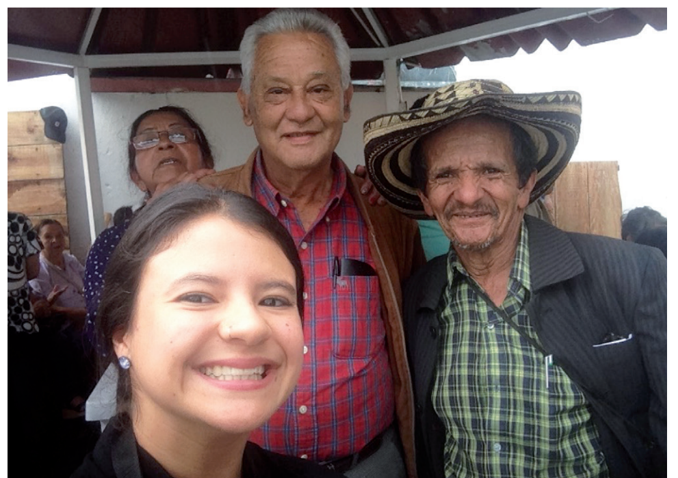
Más de 200 adultos mayores de Riosucio (Caldas) participaron en el proyecto.

¿Aprendizajes? Muchos desde el punto de vista personal y profesional, dado que la