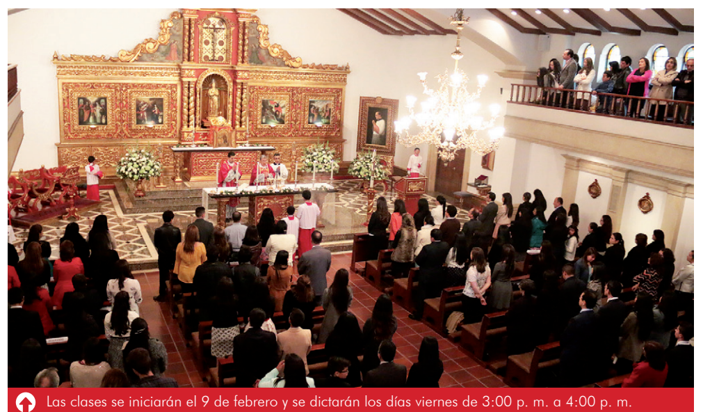
Las clases se iniciarán el 9 de febrero y se dictarán los días viernes de 3:00 p. m. a 4:00 p. m.

Lugar: Secretaría de la Capellanía Universitaria. Teléfono: 861 5555. Ext.: 10095. Correo electrónico: carmen.hernandez@unisabana.edu.co