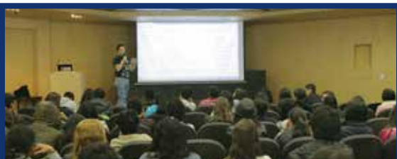
■ Durante la reinducción de la Facultad de Comunicación.

El pasado jueves 4 de septiembre, en el Auditorio David Mejía Velilla, se llevó a cabo la reinducción de estudiantes de primer semestre de la Facultad de Comunicación, con el objetivo de reforzar aspectos generales relacionados con el éxito académico y seguir contribuyendo a la adaptación a la vida universitaria, de los futuros comunicadores.