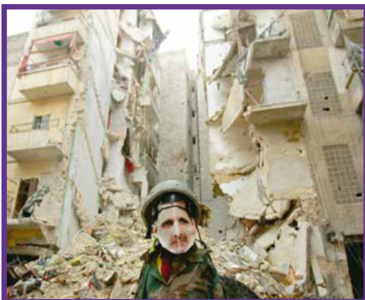
■ Fotografía del diario The New York Times , tomada por fotógrafo colombiano en Aleppo, uno de los focos de la Guerra Civil en Siria.

Para conocer más sobre el trabajo de Mauricio Morales, consulte el siguiente enlace: https://www.behance.net/mauriciomorales .