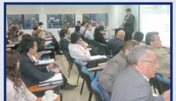
■ Conferencia “Aportes de la Cadena de Abastecimiento a la Estrategia del Negocio”.

El objetivo de la conferencia era que los estudiantes adquirieran una visión clara, por medio de un caso exitoso, sobre la manera en que una cadena de abastecimiento agrega valor a la estrategia de negocio, a través de la integración de procesos alineados a la estrategia de marketing. Todo ello, soportado con un equipo de trabajo de alto desempeño.