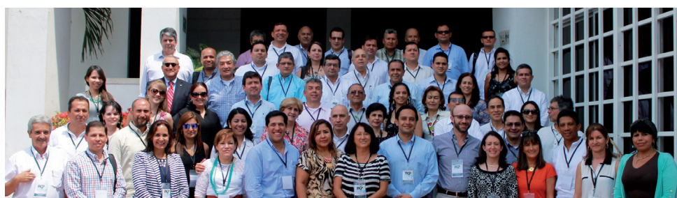
■ Asistentes a la Asamblea Anual de Rectores de la Red Colombiana de Postgrados, el 25 de abril de 2014, en la Universidad Tecnológica del Caribe (Cartagena).

El Instituto de Postgrados - FORUM —IPF—, por delegación del Rector, representa a la Universidad en la Red Colombiana de Postgrados —RCP— desde 2013.