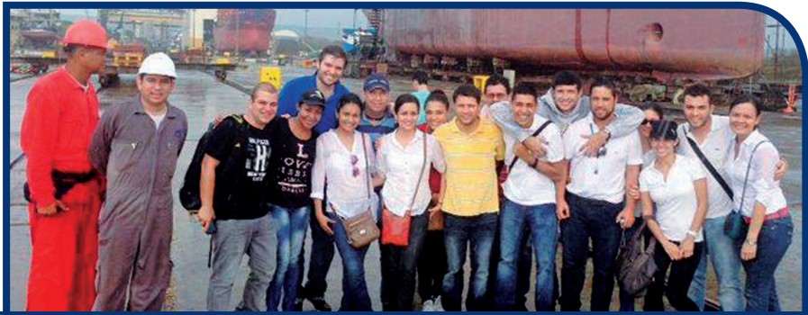
■ Estudiantes de la especialización en Gerencia Logística, durante la visita académica a la empresa Cotecmar (Cartagena).

El 2 de mayo, dieciséis estudiantes de la especialización en Gerencia Logística realizaron una visita académica con enfoque logístico a las empresas: Sociedad Portuaria de Cartagena, Abocol S. A. y Cotecmar. Durante la visita, los estudiantes