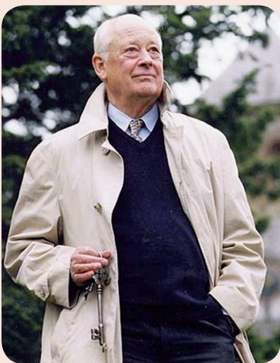
■ Charles Handy.

La solución a esta situación exige un compromiso mutuo entre personas y organizaciones y una colaboración permanente entre diversos actores sociales y el Estado. Este enfoque integrado permitirá que se articulen políticas públicas que hagan compatible la vida familiar y laboral para todas las personas y que las organizaciones potencien al ser humano como centro de las mismas.