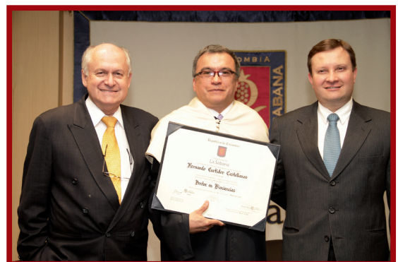
■ A la ceremonia de investidura asistió el doctor Manuel Elkin Patarroyo.