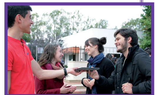
Estudiantes de Administración de Instituciones de Servicio