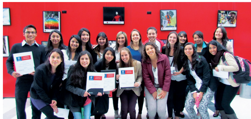
■ Alumnos Distinguidos durante la ceremonia.

La Facultad los felicita a todos y los anima a continuar en este camino de excelencia.