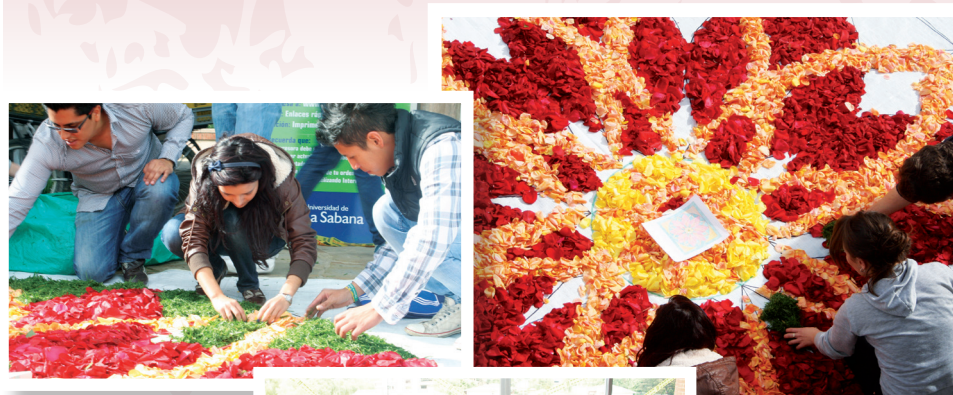
■ Estudiantes en la preparación del Corpus Christi.