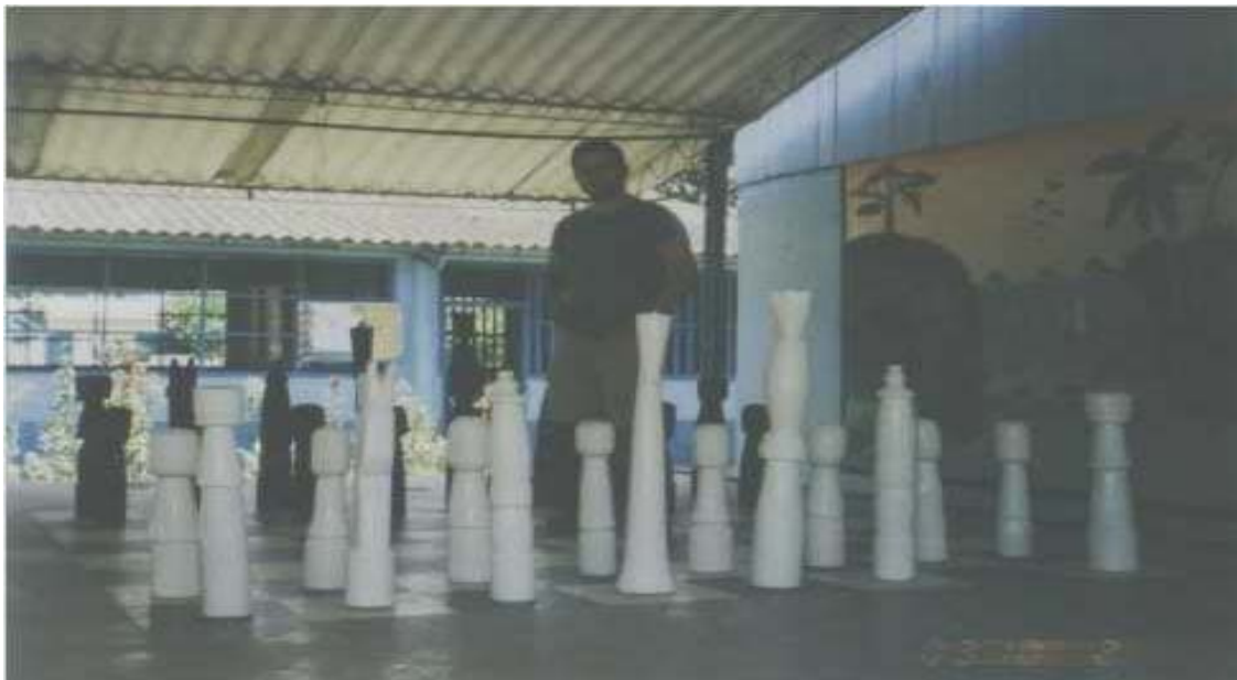
Ajedrez construido en palo balsa por los estudiantes indígenas y colonos grado VIII del colegio Manuel Quintín Lame de Barrancominas Guainía, material propio del medio para fortalecer el área de educación artística.