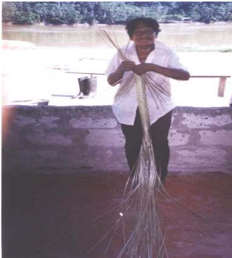
Chaman y artesano de la etnia Piapoco de la comunidad de Pueblo Nuevo. Construye un Sebucán para exprimir la yuca brava y elaborar de esta manera el famoso mañoco.