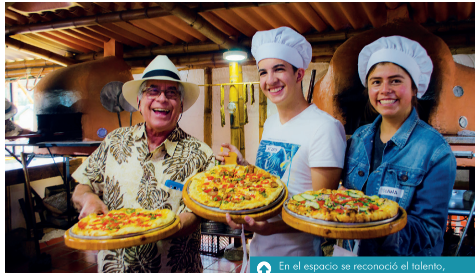
En el espacio se reconoció el talento, esfuerzo y componente innovador de estos negocios y, al mismo tiempo, se sensibilizó a los participantes sobre la provincia Sabana Centro.