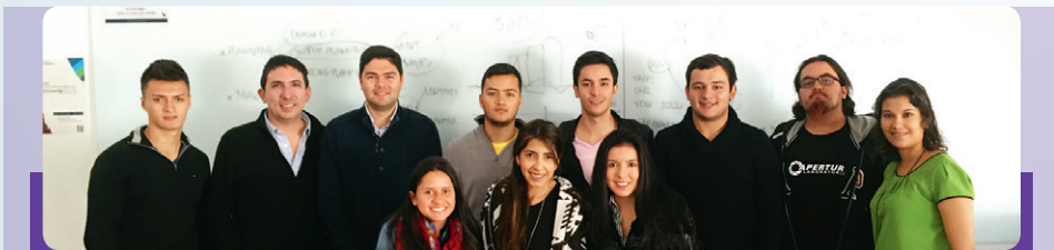
■ Miembros de la multinacional Unilever y los estudiantes de la materia de Logística.

“Propiciar estos espacios de análisis, reflexión y toma de decisiones en el salón de clase constituye una oportunidad que le permite a los estudiantes comprender y poner en práctica los conceptos teóricos de la disciplina logística, así como plantear diversas maneras de aproximarse a la solución de un problema con pensamiento crítico y a desarrollar su capacidad de analizar los riesgos y el alcance de sus decisiones”, añadió el profesor Jarrin.