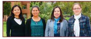
Grupo de investigación y redacción de la columna