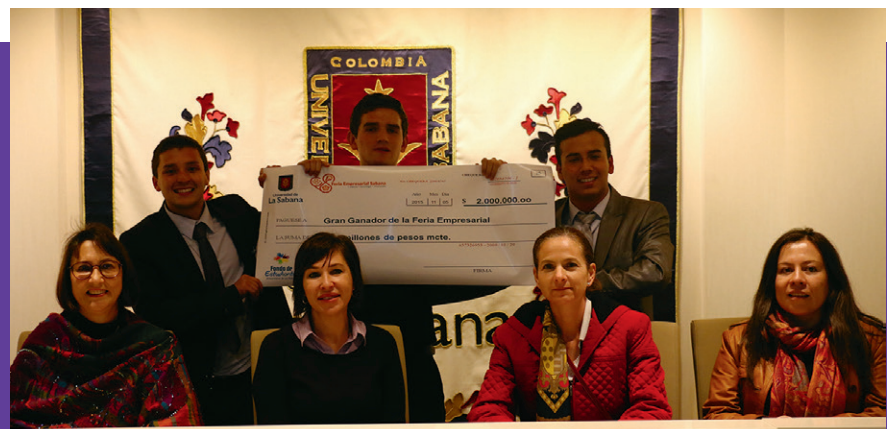
■ StockDown, ganadores de la Feria Empresarial 2015-2.