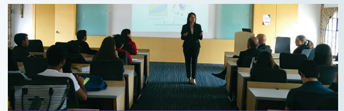
■ La conferencia contó con la asistencia de estudiantes y profesores.

Con la participación de 49 estudiantes, profesores y conferencistas, el programa de Administración & Servicio llevó a cabo —el 10 de noviembre— la conferencia Service Science, con el servicio como ciencia en IBM.