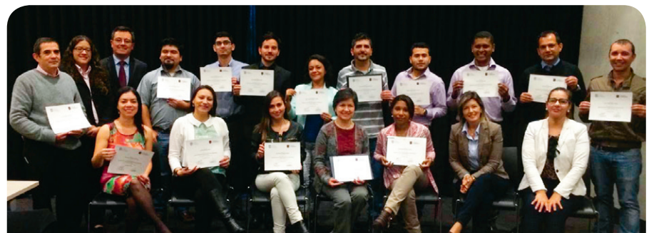
■ El objetivo del curso fue dar al participante las bases para el uso seguro de los medicamentos a través de la revisión del alcance de la Farmacología Clínica.

El Departamento de Farmacología Clínica y Terapéutica de la Clínica Universidad de La Sabana finalizó el Curso Taller Seguridad del Paciente desde la Perspectiva del Medicamento, el pasado 7 de noviembre, cuando se entrenaron a profesionales de la salud en el uso seguro de los medicamentos oncológicos, mediante una modalidad virtual y presencial de seis meses de duración, con el patrocinio de Laboratorios Roche y la coordinación logística de Visión OTRI.