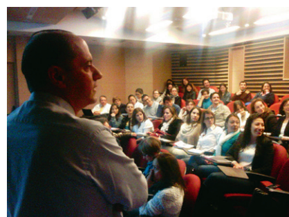
■ Durante el encuentro, los estudiantes, graduados y profesores compartieron un espacio caracterizado por el gran aporte educativo y la formación.

Para los participantes, las conferencias fueron una oportunidad para adquirir herramientas educativas de gran utilidad para su vida personal y profesional.