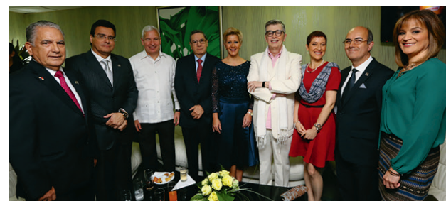
Jurados del concurso junto con la Primera dama de Panamá.

En este certamen, se presentó y reconoció a un grupo selecto de jóvenes estudiantes que, alrededor de la oratoria en español, disertaron sobre el valor del emprendimiento como factor esencial del desarrollo del país y como motor de la cultura solidaria que este genera.