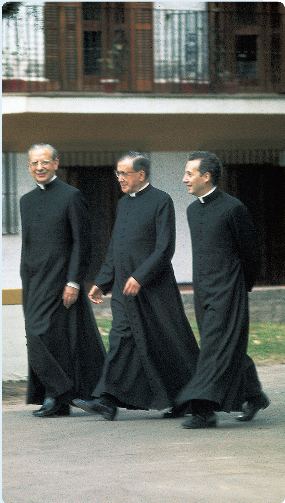
■ De izquierda a derecha beato Álvaro del Portillo, san Josemaría Escrivá de Balaguer y Mons. Javier Echevarría.

Durante el trayecto, en un carro muy viejo, pasaron felices. El Padre cantaba, hablaba de apostolado, les gastaba bromas. El trayecto, un tanto azaroso, le puso muy mal, se mareó, vomitó. Pero como a un niño pequeño, el Padre le ayudó, le limpió, abrió la ventanilla y fueron con ella abierta en un trayecto largo, en pleno noviembre, en el que hacía mucho frío. Eso le marcó por completo y para siempre.