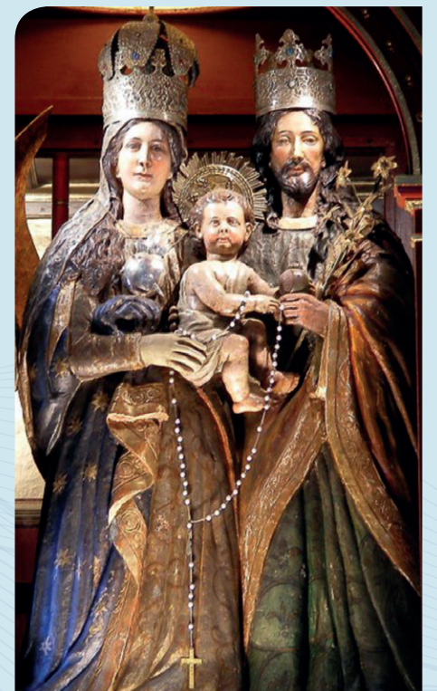
Advocación de Nuestra Señora de la Peña.