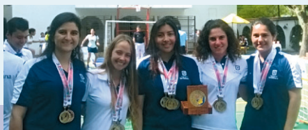
■ Selección de Natación.