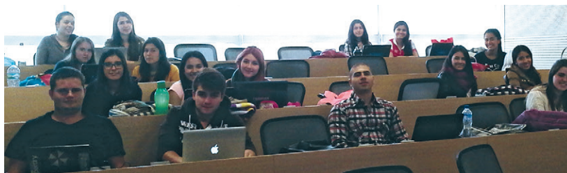
■ Algunos estudiantes que cursaron la materia CBD en 2015-1.

Este trabajo de campo incentivó a los estudiantes de la materia CBD a investigar, proponer, crear, trabajar en equipo, perder el miedo a hablar en público y a analizar con sentido crítico