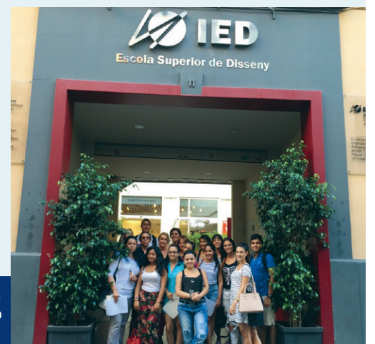
■ Delegación de la Universidad de La Sabana en el curso de verano del Instituto Europeo de Diseño, en Barcelona.