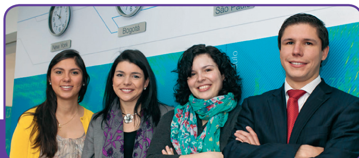
■ El grupo se ha preocupado por hacer aportes a los debates jurídicos de actualidad.