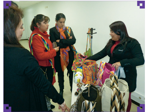
Directiva de la Facultad de Educación y la delegada de la Fundación, que ofrece productos hechos por el pueblo wayuu.

*Extractos del prólogo “ Tejedoras de Vida ”.