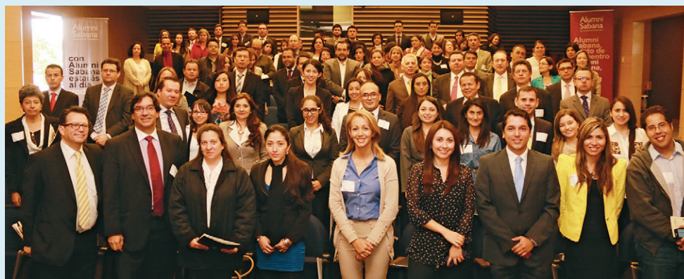
■ Jornada de Actualización Académica, Facultad de Derecho y Ciencias Políticas.

Conoce más servicios y beneficios en educación, salud y bienestar, como futuro Alumni Sabana.