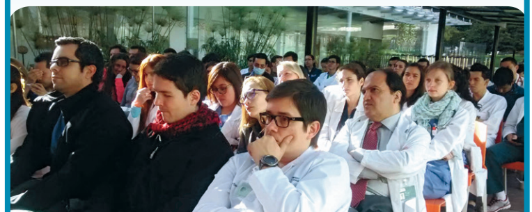
Quinta jornada de Grand Round en la Clínica Universidad de La Sabana.

El Grand Round es un espacio de discusión académica, entre médicos, especialistas, estudiantes y profesores, en el que se analiza un caso clínico discutiendo el diagnóstico paraclínico, el diagnóstico diferencial y el abordaje terapéutico.