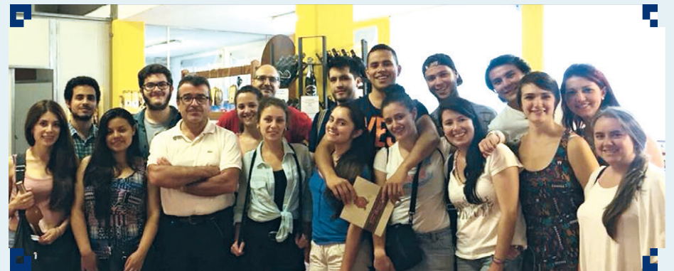
■ Delegación del programa de Gastronomía, durante una de las visitas académicas del curso de verano en Italia.

La jefe de Internacionalización de la EICEA también viajó para acompañar al grupo y para reunirse con la Universidad Católica del Sacro Cuore y continuar explorando nuevas oportunidades de cooperación entre nuestras instituciones.