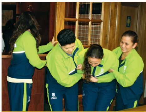
Una vez terminado el simulacro, se realizará una actividad de integración por equipos.

Así, se convoca a los miembros de la Brigada de Emergencias de Inalde y de la Universidad a participar activamente en esta sesión de entrenamiento.