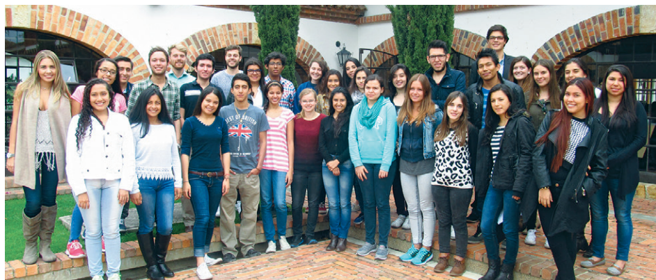
■ Grupo de estudiantes internacionales y nacionales que participaron de la inducción organizada por la Dirección de Relaciones Internacionales, el pasado 21 de julio.