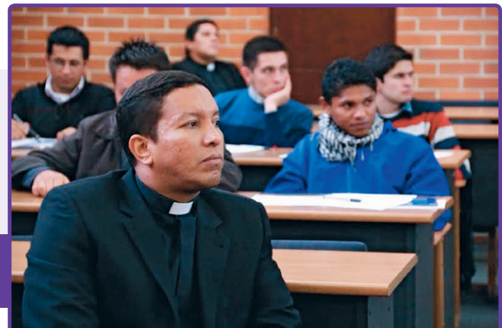
Asistentes al XXVII Curso Internacional de Actualización Teológica.

El pasado 13, 14 y 15 de julio se realizó el evento con el objetivo de reflexionar acerca de la institución familiar, dando herramientas a los sacerdotes y seminaristas participantes para fortalecer los valores de la familia en sus respectivas comunidades.