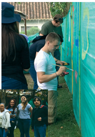
■ Equipo de las Vacaciones Solidarias.

una cerca en la Fundación Tierra, Amor y Paz; organizaron un Taller de Padres con familias del Jardín Social Semillitas de Alegría, en el que también celebraron el Día del Niño, y visitaron un colegio en la vereda La Balsa, donde impartieron clases de matemáticas e inglés y organizaron pruebas deportivas con los niños.