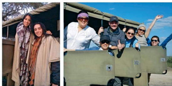
■ Lugares y momentos maravillosos fueron los que vivieron las 14 personas de la Universidad de La Sabana que participaron en la Salida Académica 2015 en Sudáfrica.