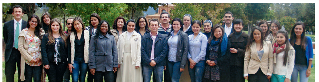
■ Los 26 estudiantes iniciaron sus estudios con muchas expectativas.

El perfil profesional, representado por educadores, administradores de empresa, religiosas, abogados, entre otros, aspira a fundar o dirigir instituciones educativas de carácter privado u oficial de los niveles de educación inicial, pre-escolar, básica, media, técnica y tecnológica en Colombia.