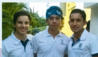
■ Selección de Squash.