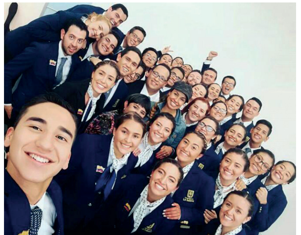
El Coro de la Universidad de La Sabana, en el concurso Cántale al Papa .

miembros del Coro nos enriquecen como personas, nos abren la mente hacia horizontes insospechados que permiten que pensemos en cómo entender cada vez más y mejor el mundo en el que estamos.