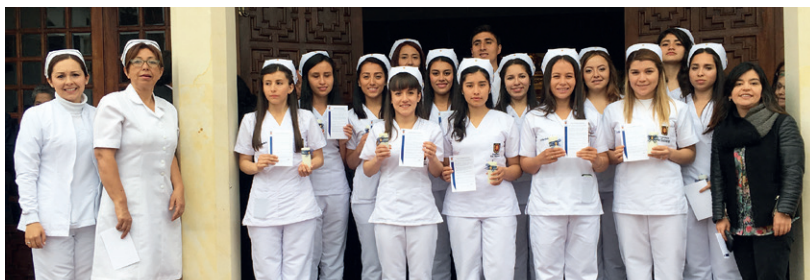
Al evento asistieron los familiares de los estudiantes, los profesores de séptimo semestre, los directivos y administrativos de la Facultad.

Esta ceremonia se inspira en el legado de Florence Nightingale, pionera de la enfermería moderna. En su memoria, las facultades de Enfermería del mundo entero realizan esta ceremonia.