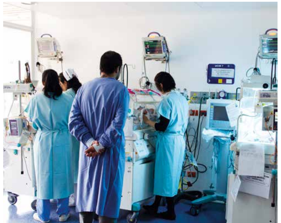
Esta investigación ofrece soluciones para garantizar la seguridad y la vida de los bebés cuando requieren reanimación al momento de nacer.

Es importante seguir desarrollando investigaciones que busquen la seguridad en la reanimación neonatal para poder garantizar la vida de los recién nacidos, sobre todo en los centros de salud de los niveles 1 y 2, donde la disponibilidad de profesionales especializados está limitada.