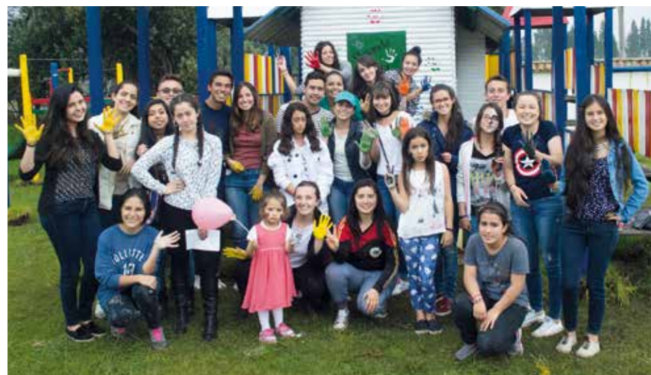
46 estudiantes del Programa Tutoría para Becarios (PTB) realizaron una labor social en el Hogar Santa Teresita.

Esta oportunidad de servicio también se convirtió en un espacio de integración