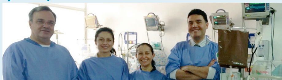
■ Los procedimientos de fertilidad en la Clínica Universidad de La Sabana tienen una tasa de éxito entre el 50% y el 85%.