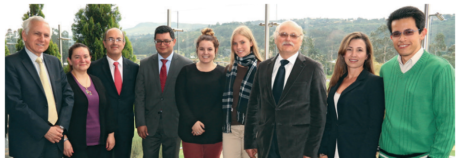
Integrantes del grupo de investigación Valor y Palabra, de la Facultad de Filosofía y Ciencias Humanas, y estudiantes de la Maestría en Lingüística Panhispánica.

Temas como los procesos de lectura y escritura crítica, la comprensión de la norma panhispánica en la didáctica de la lengua española, como lengua propia y como segunda lengua, unidos a las preocupaciones por la conexión entre el español, la cultura y el entorno empresarial, fueron algunos de los asuntos tratados en este primer acercamiento académico.