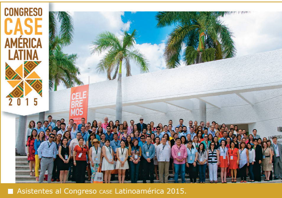
Asistentes al Congreso CASE Latinoamérica 2015.

El Congreso, que contó con invitados de las universidades de Los Andes y la de La Sabana (por Colombia), y de México, República Dominicana y Chile, centró su objetivo en “conocer nuevas estrategias en procuración de fondos, vinculación con exalumnos, comunicación y mercadotecnia que han realizado instituciones de educación superior en Latinoamérica y los Estados Unidos”.