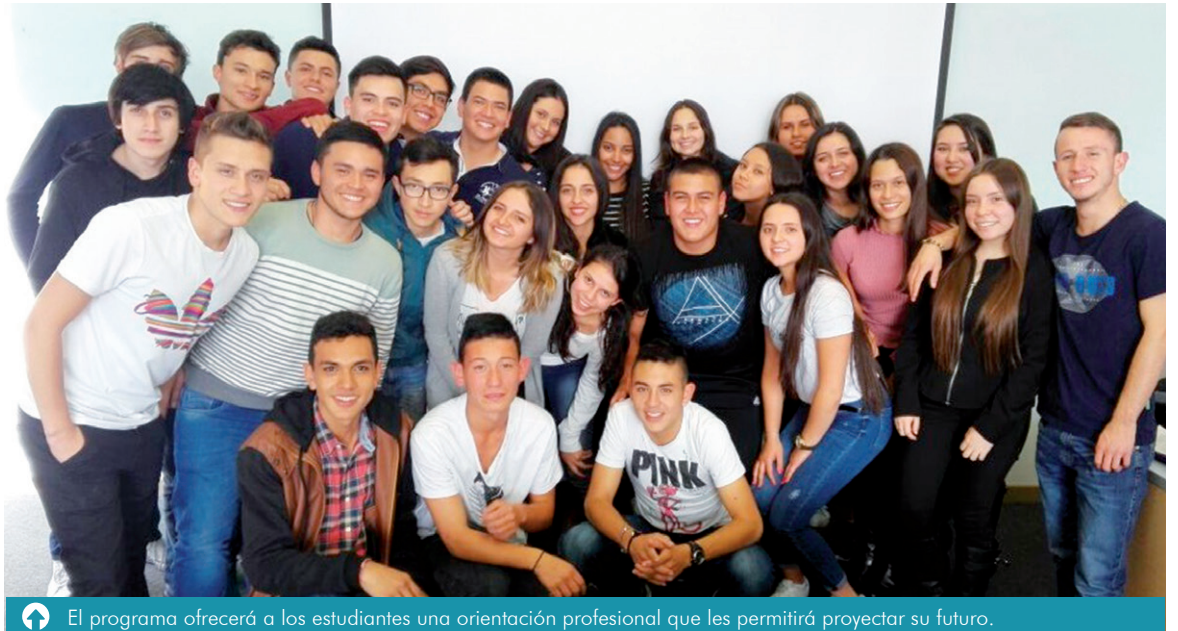
El programa ofrecerá a los estudiantes una orientación profesional que les permitirá proyectar su futuro.

Durante más de 15 años, el PIU ha formado a cerca de 600 jóvenes, quienes vieron en él una oportunidad para reconocer la vida universitaria, lo que ella implica y la exigencia que supone, en términos de responsabilidad y compromiso.