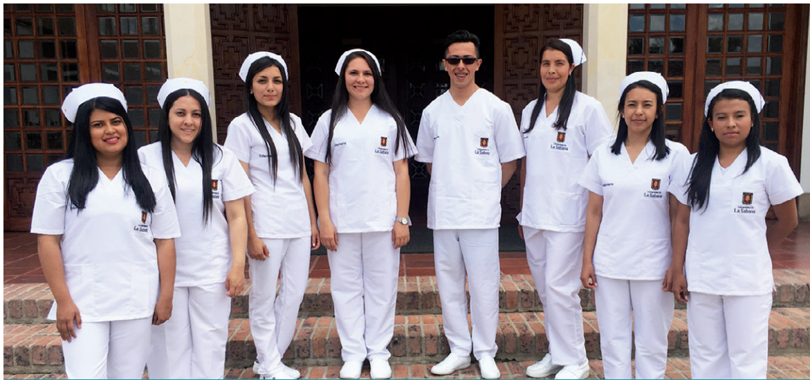
Los estudiantes de Enfermería que recibieron la Imposición de Símbolos.