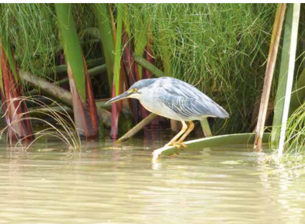
Garza. Butorides striata