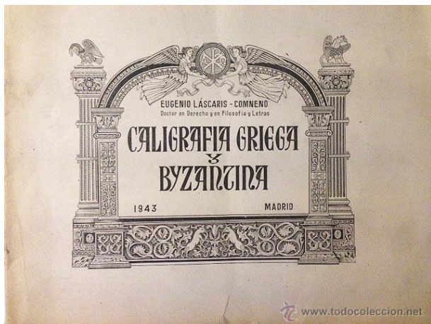
Ex Libris de don Eugenio II Láscaris-Comneno.