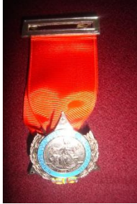
Medalla Conmemorativa de los 80 años, categoría Oro, acuñada en 1974: