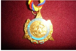
Medalla de Miembro Correspondiente: