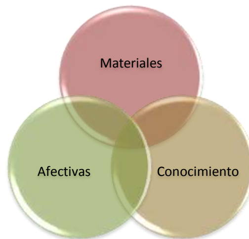
Ilustración 3. Necesidades Humanas

Según este enfoque, las 3 necesidades siempre están presentes en las personas y no presentan un nivel de jerarquía, como sí se veía en las anteriores teorías de los otros 2 modelos (mecanicista y psicosociológico).