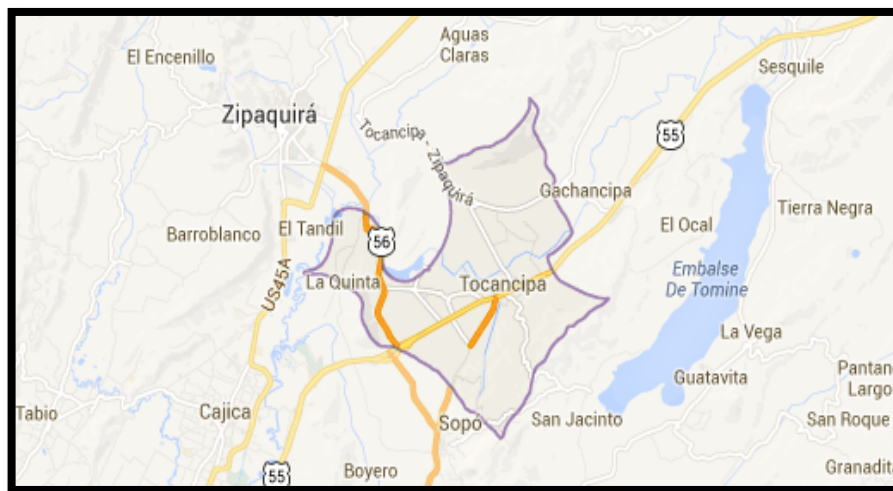
Gráfico 1 Mapa de Tocancipá