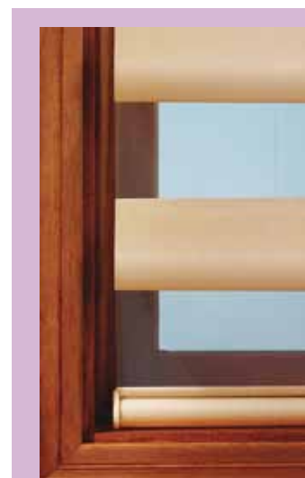
Último pliegue parte inferior.