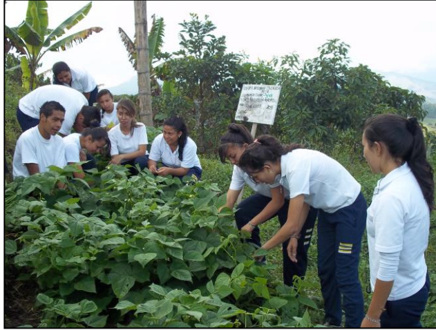
Figura 5. Estudiantes aplicando el conocimiento en los proyectos productivos.

El último capítulo del presente informe, titulado “Después de comprender, acciones para emprender”, presenta las conclusiones y las recomendaciones desde la innovación educativa, producto de la reflexión de los investigadores, después de recoger las voces de los estudiantes frente a los proyectos pedagógicos productivos y el emprendimiento, se pudo deducir que urge la necesidad de escuchar al estudiante al planear y ejecutar el acto educativo.