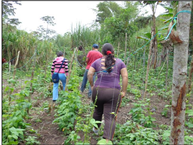
Figura 2. Visita a un proyecto productivo.

El segundo capítulo denominado “Caminos recorridos y saberes construidos”, comprende el marco de referencia de la investigación, conformado por dos apartados: el marco legal y el marco teórico. El primero trata sobre las normas vigentes que existen en el país frente a la educación rural, los proyectos pedagógicos productivos y la cultura del emprendimiento. El segundo aborda el rastreo teórico sobre las categorías principales que orientan la investigación: representaciones sociales y voces de los estudiantes, ruralidad y educación, proyectos pedagógicos productivos y cultura del emprendimiento.