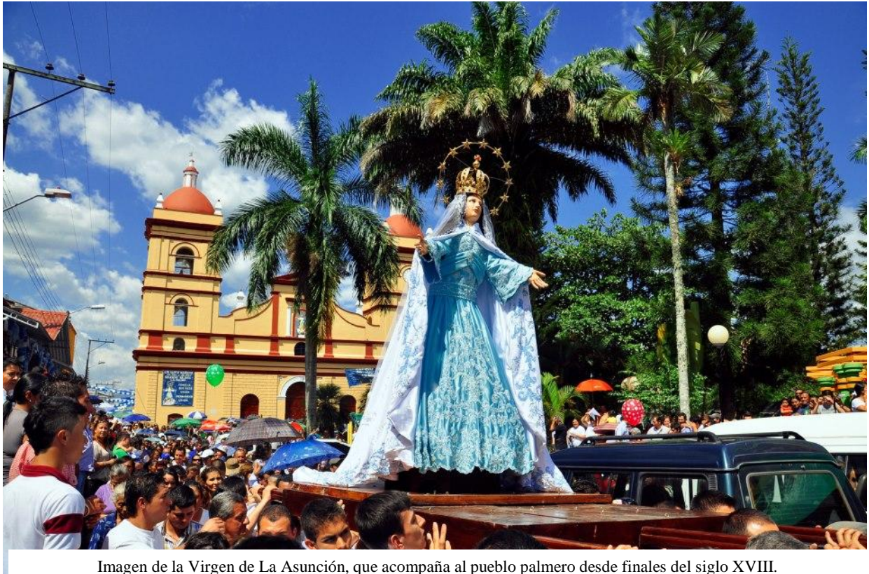
Imagen de la Virgen de La Asunción, que acompaña al pueblo palmero desde finales del siglo XVIII.

A Dios Todopoderoso y a la Santísima Virgen de la Asunción de La Palma. Nuestra madre intercesora, que en su Vigésima bajada, nos acompañó en el camino de la investigación y nos concedió la gran bendición de culminar con éxito esta Maestría.