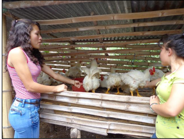
Figura 4. Estudiantes explicando un proyecto productivo.

El capítulo cuarto denominado “Develando las representaciones sociales de los jóvenes rurales”, refiere la descripción e interpretación de los hallazgos de la investigación.