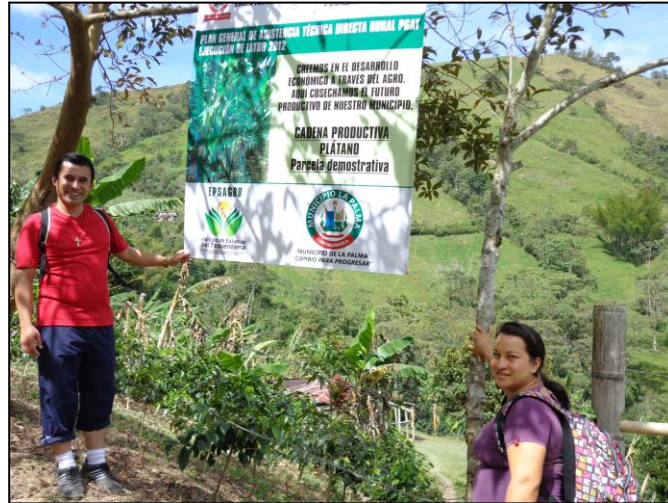
Figura 3. Investigadores recorriendo las fincas de los estudiantes.

El tercer capítulo “La ruta emprendida” está dedicado al diseño metodológico de la investigación, incluye la definición del enfoque metodológico, la descripción del contexto y los participantes, el procedimiento y los instrumentos aplicados.