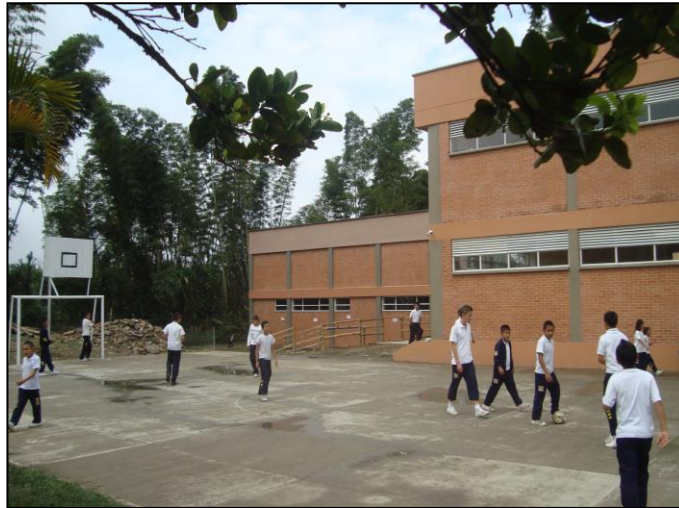
Figura 1. Instalaciones y estudiantes IED Minipí de Quijano.

Este primer capítulo titulado “Cuestiones que nos inquieten”, presenta el hilo conductor del presente estudio. Está constituido por el problema, los objetivos, la justificación y los antecedentes de la investigación.