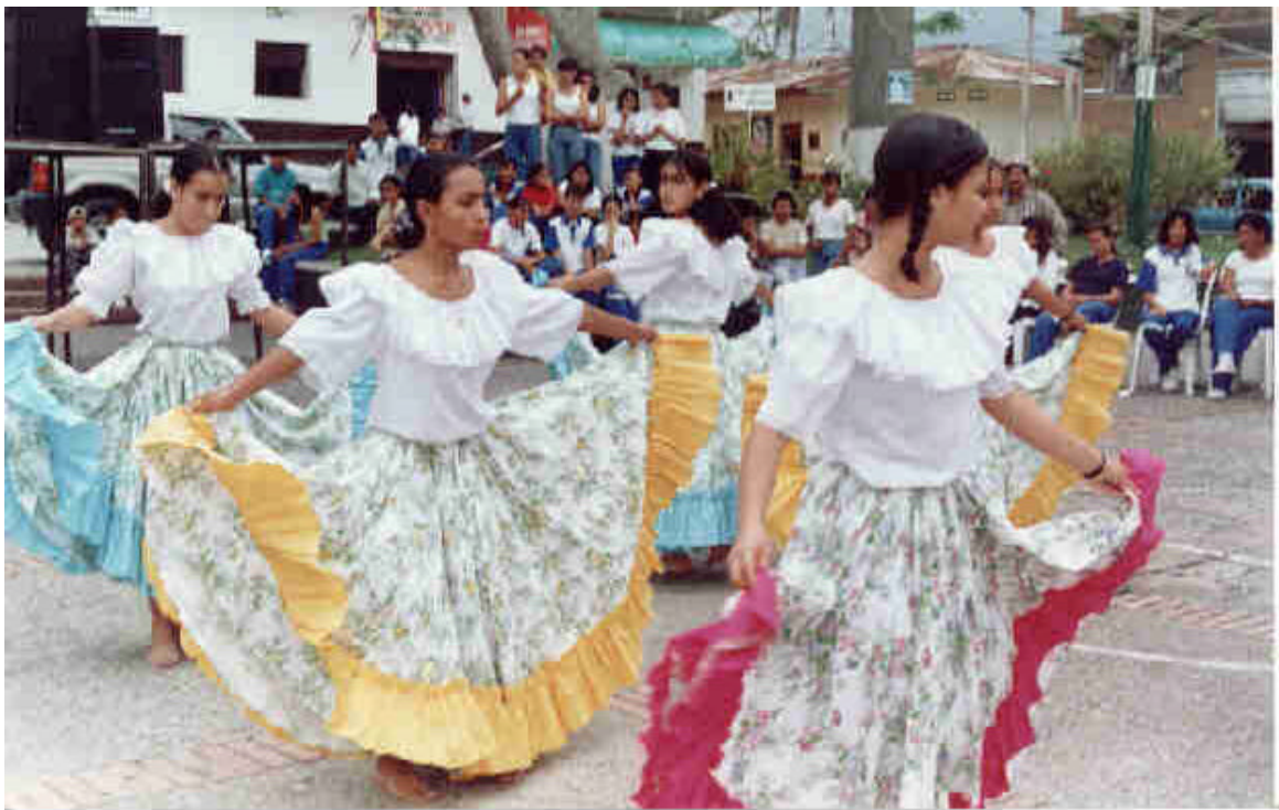
FESTIVAL DE MÚSICA CAMPESINA

caballo de mejor paso, corrida de toros en la monumental plaza de toros La Sanjuanera, considerada entre una de las mejores en Cundinamarca, celebración del día del campesino con exposición de productos agrícolas de la región y trabajos artesanales, presentación de diferentes danzas y bailes típicos de la región.