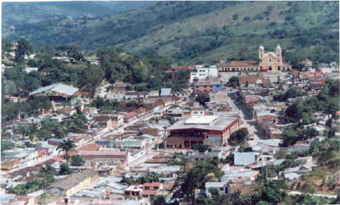
PANORÁMICA DEL MUNICIPIO DE SAN JUAN DE RIOSECO

La cuenca hidrográfica del Rioseco de San Juan tiene varias quebradas que sirven de sustento para centenares de familias, así como algunas lagunas que son representativas por su significado histórico, porque en ellas se han dejado leyendas que han sido motivo de curiosidad de muchas generaciones como son: la laguna Verde y la laguna de San Vicente.