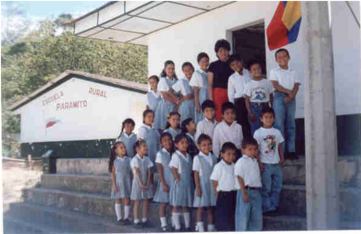
ESTUDIANTES, DOCENTE E INSTALACIONES DE LA ESCUELA RURAL PARAMITO