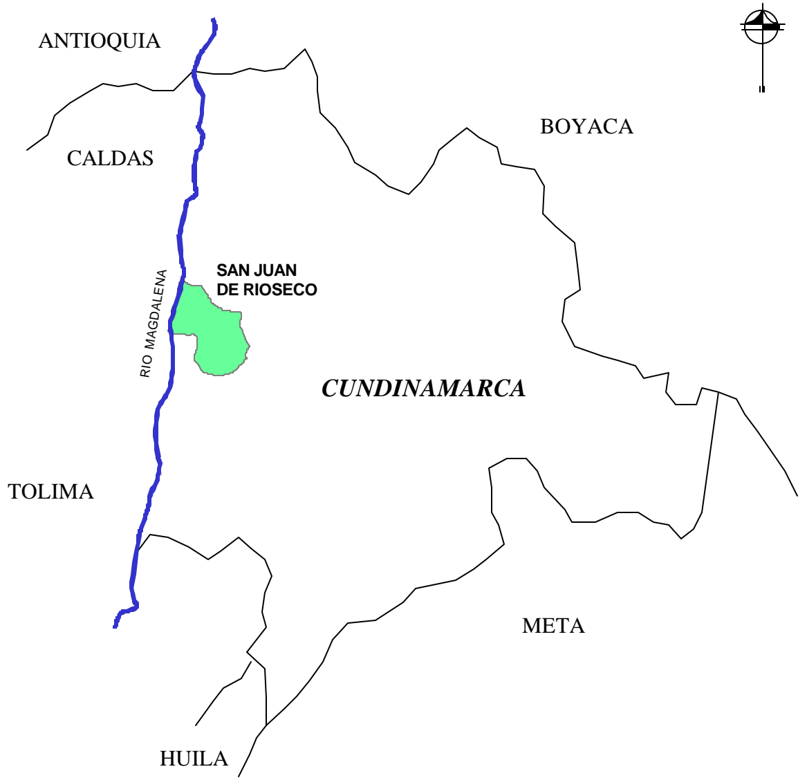
LOCALIZACIÓN DEL MUNICIPIO DE SAN JUAN DE RIOSECO