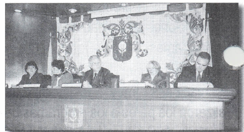
Mesa Directiva de las conferencias desarrolladas en el Día del Idioma