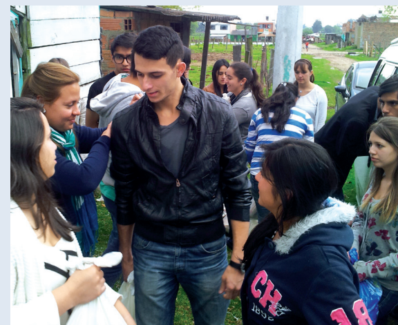
■ Durante la jornada de solidaridad de los estudiantes del Programa Tutoría para Becarios.

Para los estudiantes fue una experiencia enriquecedora, que les significó grandes enseñanzas y un sentido de compromiso social más fuerte, ya que vieron la necesidad de tener una mayor iniciativa de ayuda con la comunidad y de esta forma disminuir la brecha de desigualdad que impera en muchas regiones de Colombia.