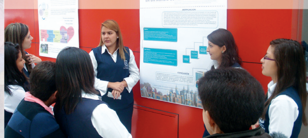
Estudiantes de Licenciatura en Pedagogía Infantil durante la jornada de Socialización de Prácticas.

A este evento asistieron profesores y administrativos de la Facultad de Educación, quienes evaluaron los diferentes pósters y a quienes se les agradece su participación y comentarios.