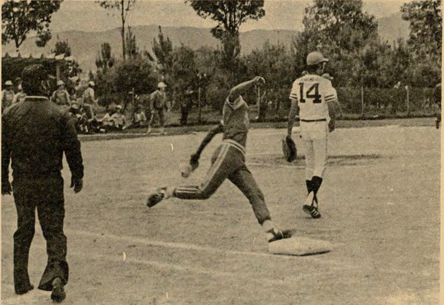
Después de batear Hit, el corredor llega quieto a primera base. La jugada se produce en un partido de Softbol, en el campo de EL SALITRE, durante el campeonato del año pasado en esta ciudad (Foto archivo de EL ESPECTADOR).

Al principio se dedicó a prácticas esporádicas por falta de elementos humanos que se dedicaran a organizarlo. Además, porque para esa época la práctica del softbol entre mujeres era algo como una audacia, por tratarse de