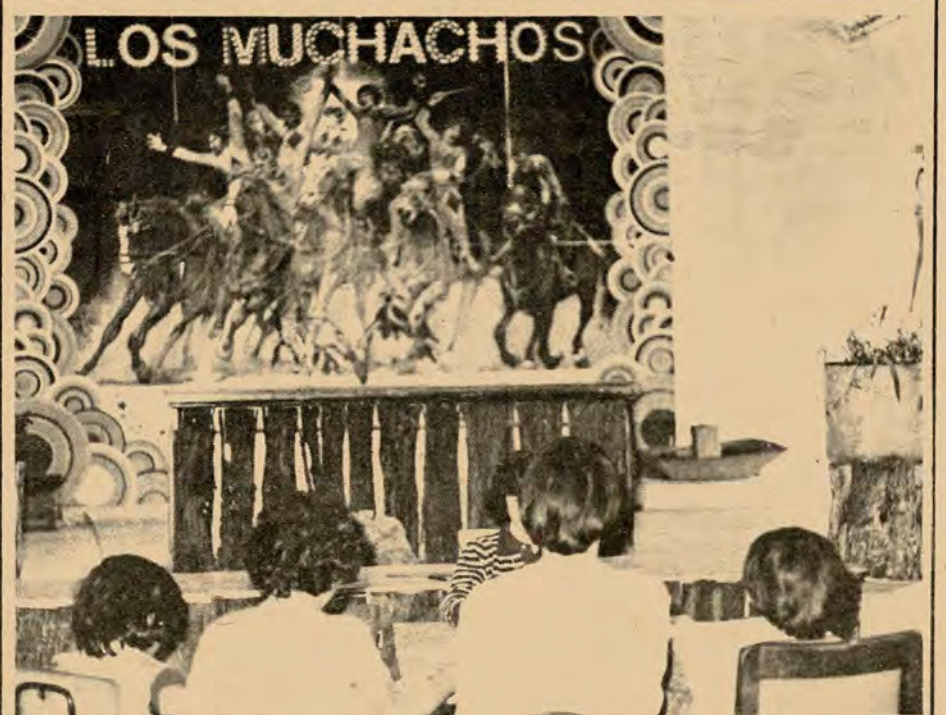
Las actividades y los estudios que realizan los muchachos no son interrumpidos por las distintas giras que hacen por el mundo. Para esto cuentan con profesores especializados y ambulantes.