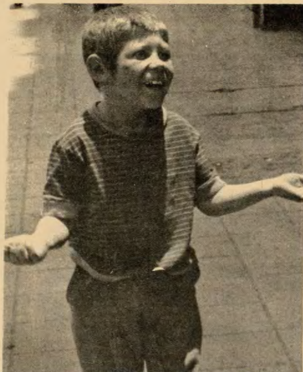
Los pocos momentos de "felicidad" manifestados en una sonrisa triste sólo tienen una respuesta: Indiferencia social.