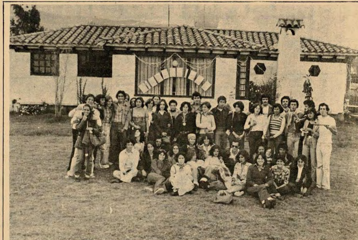
Los estudiantes del primer semestre de Comunicación Social, resolvieron conocerse más. A los pocos días de iniciadas las clases organizaron un almuerzo campestre en una finca cercana a Bogotá y de propiedad de una compañera. Los "primiparos" como cariñosamente se les llama, ya están organizados. ¡Buena suerte!

Alumnos de V Semestre de Comunicación Social.