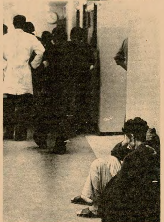
DE ESPALDAS AL DOLOR Mientras un paciente espera en el pasillo por no haber espacio donde ubicarlo, el doctor le da la espalda para observar un caso de urgencias.

El departamento materno-infantil corre diariamente el peligro de paralizarse ya que el desaseo es imprecionante, pues, las madres que van a tener sus hijos corren el riesgo de perderlo en el peor de los casos morir a causa de la falta de esterilización de los implementos quirúrgicos, además es una gran amenaza no solo para pacientes sino también para empleados