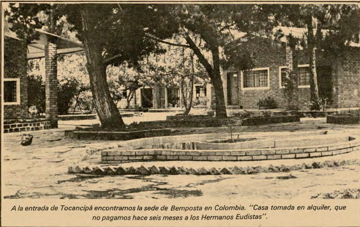
A la entrada de Tocancipá encontramos la sede de Bemposta en Colombia. "Casa tomada en alquiler, que no pagamos hace seis meses a los Hermanos Eudistas".