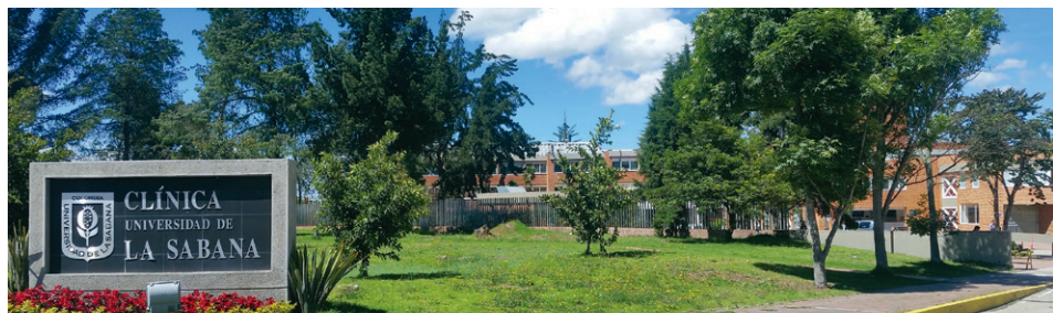
La Clínica se encuentra en el puesto 13 en Colombia y en el quinto de las instituciones ubicadas en Bogotá.

Para la Clínica, este reconocimiento es muy importante, pues permite establecer una comparación con instituciones de gran trayectoria, tamaño y capacidad.