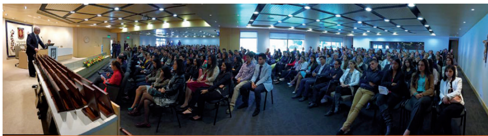
Palabras del rector a los asistentes al evento.

En esta ceremonia también se galardonó la excelencia académica de los estudiantes y la calidad de enseñanza de los colegios de los alumnos ganadores. Este espacio, de igual forma, permitió el acercamiento con otros alumnos y los rectores de los colegios, quienes conocieron el campus de La Sabana.