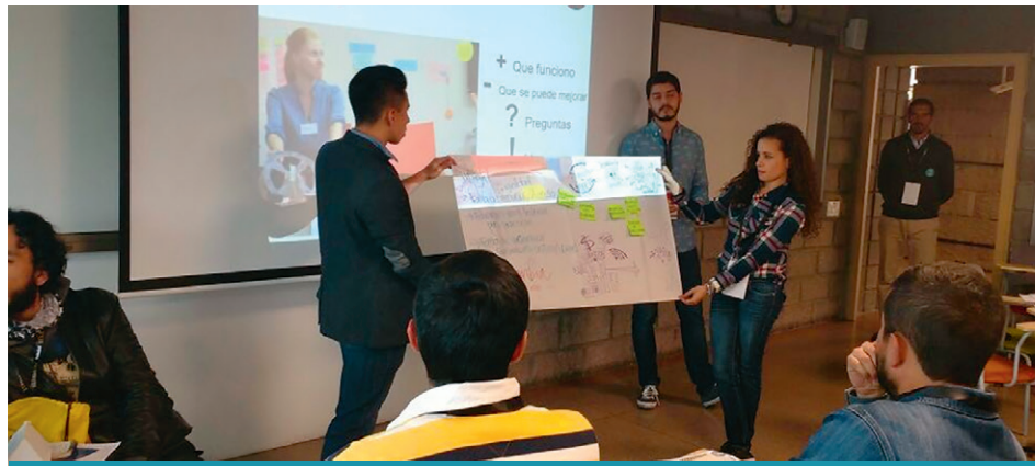
La Universidad fue parte de las charlas y talleres de “Héroes Fest 2016”, festival de innovación, emprendimiento, educación y ciencia.