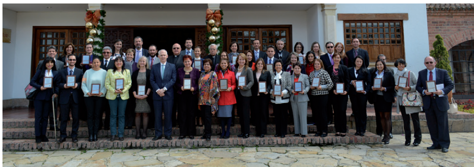
Rectores y directivos de colegios, con el rector de la Universidad de La Sabana y el director de Admisiones.