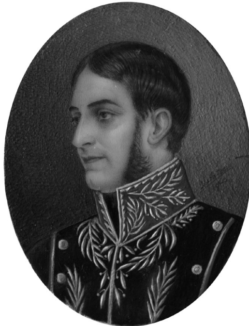
Ilustración de Sandra Milena García Saldarriaga basada en la obra: