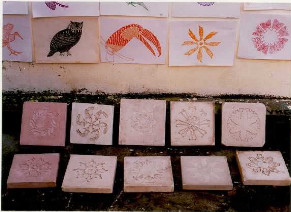
ANEXO R. Secado al aire libre de los módulos o teselas.