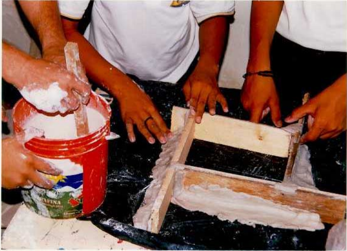
ANEXO F. Tercer paso para elaborar las placas de yeso: Mezclar con un Agitador.