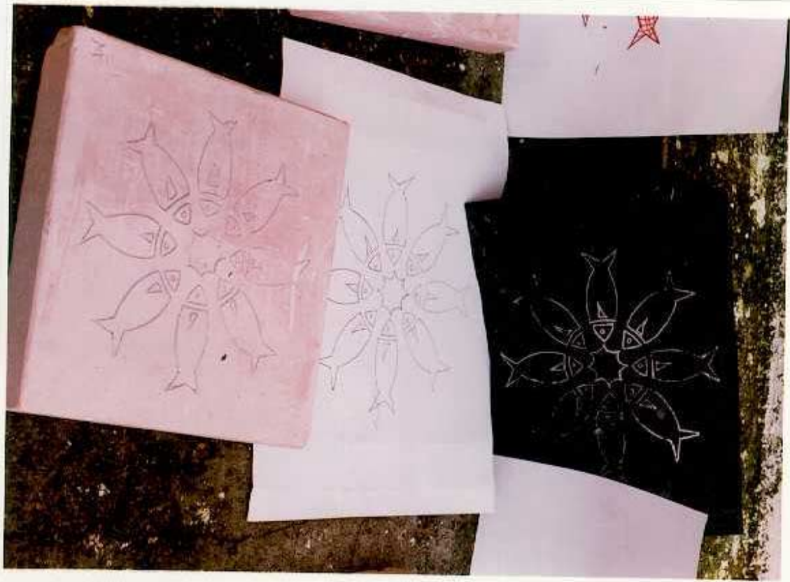
ANEXO K. Calcado de las placas de yeso.