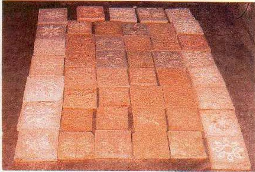
ANEXO T: Mural.