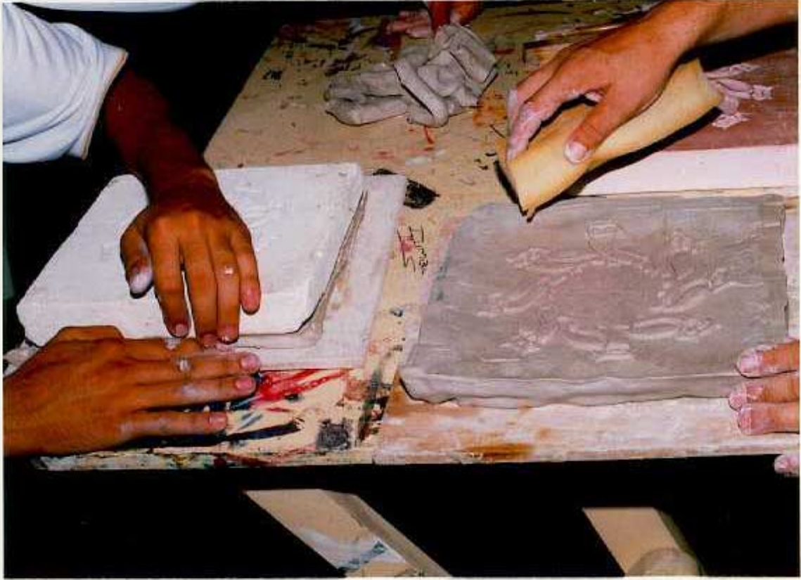
ANEXO Q. Tercer paso para el estampado sobre las placas de yeso talladas en bajo relieve. Dejar endurecer y luego retirar la placa de arcilla de la placa de yeso.