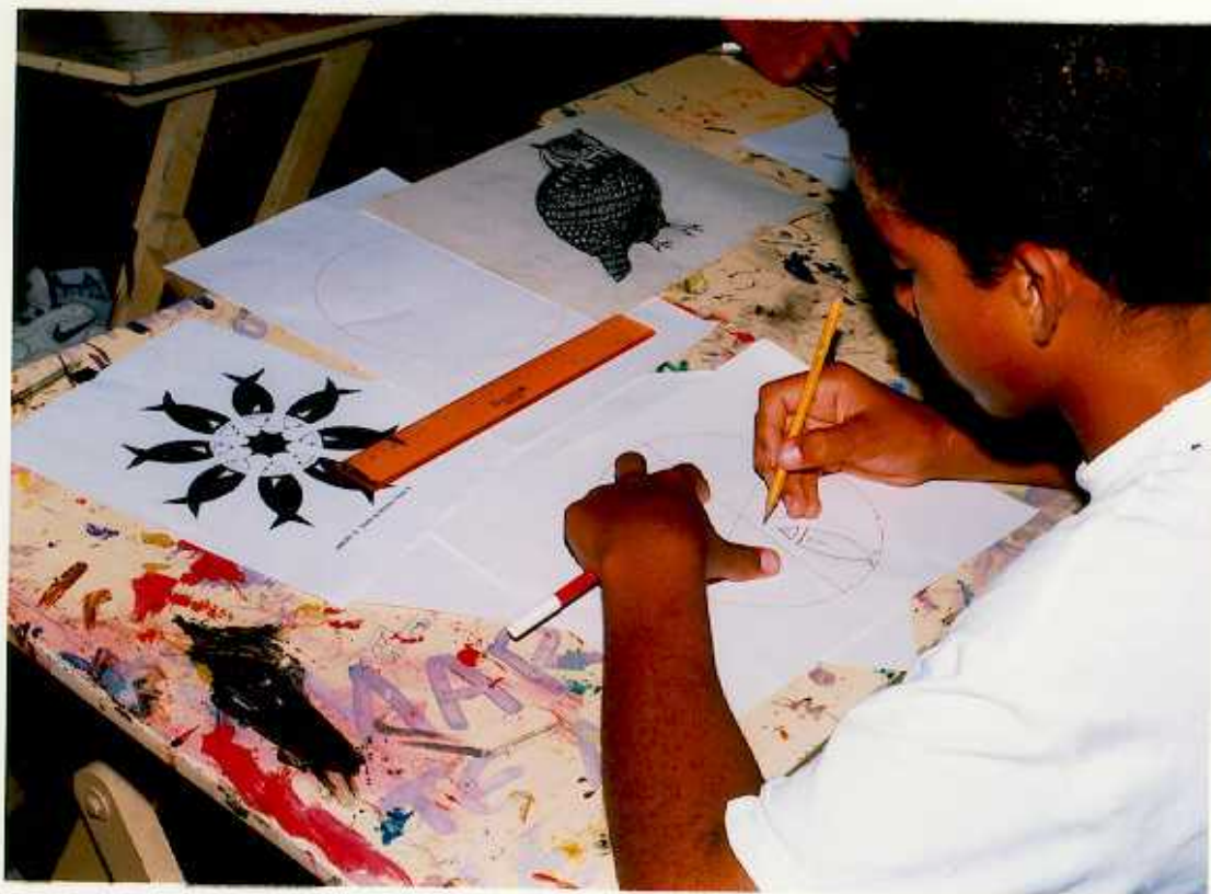
ANEXO C. Elaboración de bocetos o diseños de los módulos con la temática escogida por el estudiante en una estructura circular radial formando un rosetón.