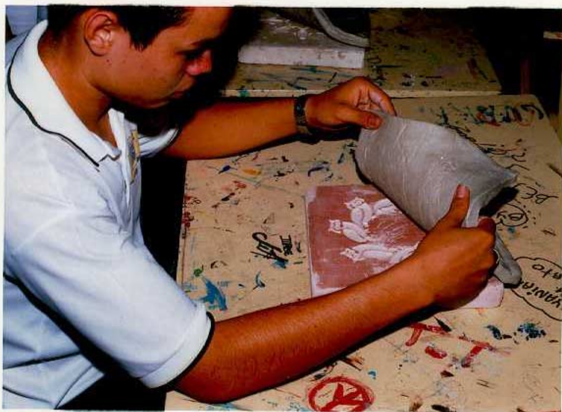
ANEXO O. Primer paso para el estampado sobre las placas de yeso talladas en bajo relieve: Aplicar una película de pasta para modelado.