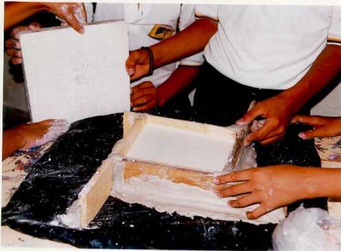
ANEXO H. Quinto paso para elaborar las placas de yeso; Dejar en reposo hasta que fragüe.