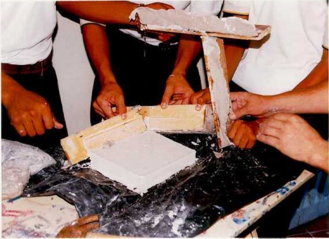
ANEXO I. Sexto paso para elaborar las placas de yeso: Retirar la formaleta.