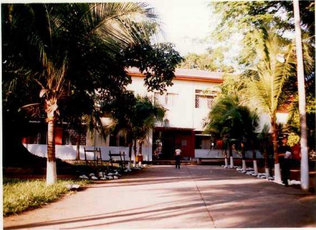
ANEXO B. Entrada principal del Colegio Nacional Santa Librada de Neiva.