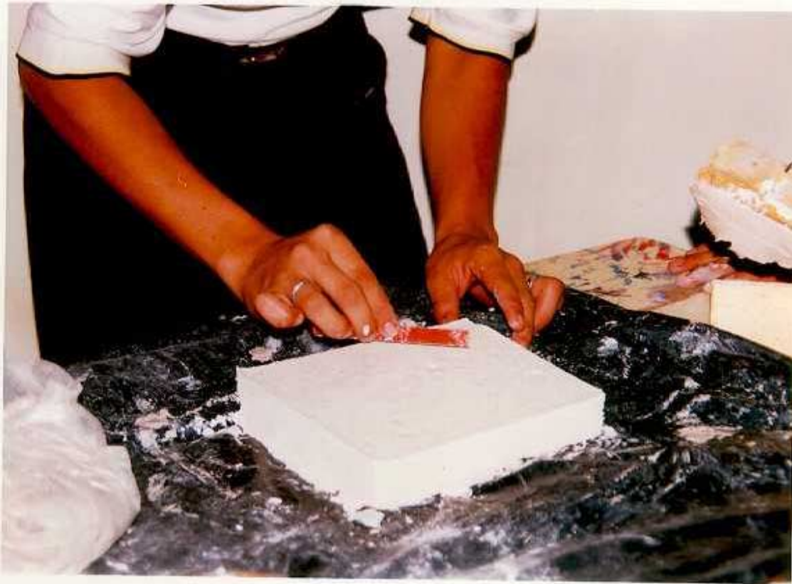
ANEXO J. Séptimo paso para elaborar las placas de yeso: Limpiar y pulir la placa de yeso.