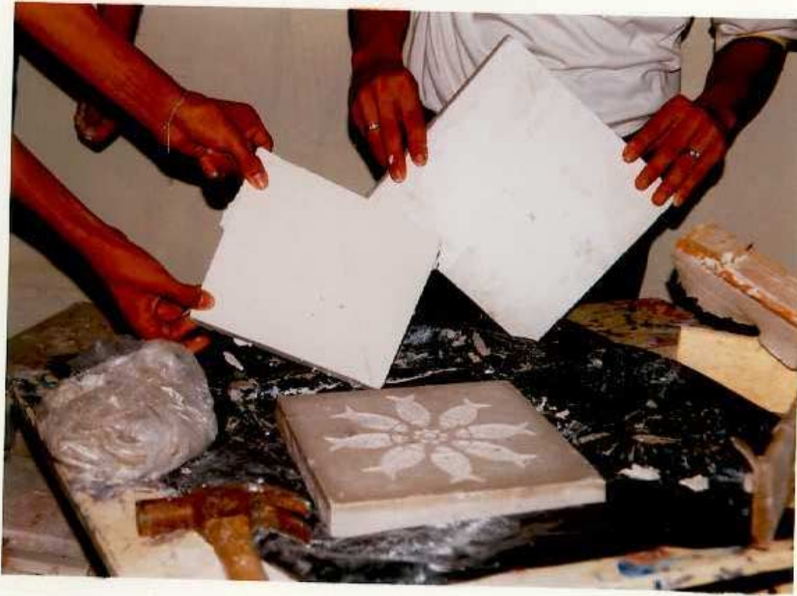
ANEXO M. Bajo relieve de la placa de yeso como resultado de la talla.