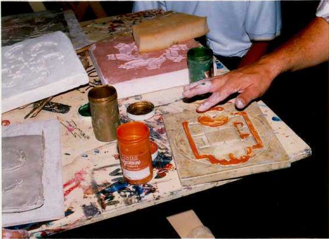
ANEXO S. Esmaltado de los módulos.