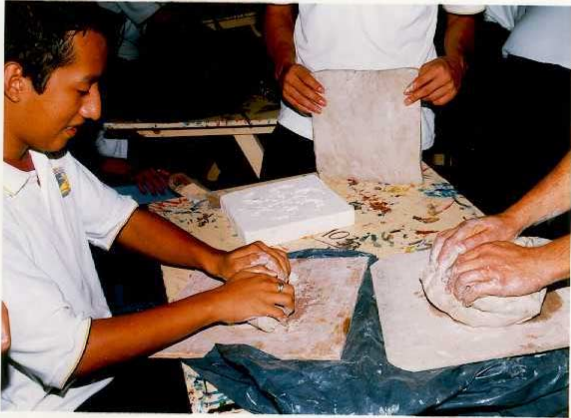
ANEXO N. Preparación de la pasta para el modelado.