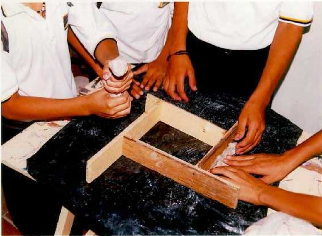
ANEXO D. Primer paso para elaborar las placas de yeso: Construcción de formaletas en madera de 25 x 25 x 10