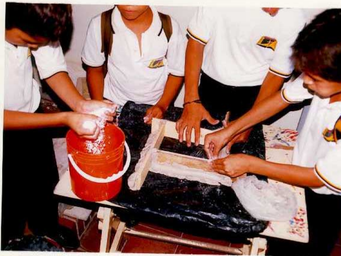
ANEXO E. Segundo paso para elaborar las placas de yeso: Se vierte en un recipiente plástico 2 kilos de yeso y media botella de agua por cada placa que se desee elaborar.