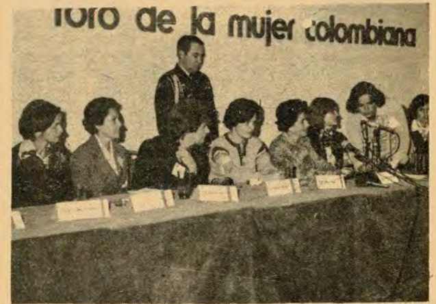
PRESENCIA DE LA MUJER

Cuando vemos a esta mujer colombiana consciente de sus problemas, conocedora de los códigos legales, de lo que le reconocen y desconocen, crítica de las situaciones nacionales e internacionales, dando su aporte de innumerables entidades públicas y privadas, que sabe lo que quiere y lo que busca, no podemos afirmar "que asume posiciones de grupo minoritario y meditante; o de turba vociferante". Podrá argumentarse que es una minoría.