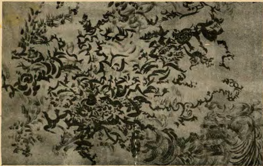
EL CANTO DE LAS AVES.

Representa para la autora, "la evolución de un par de años y una cantidad de sentimientos muy bellos que pudo expresar y que así fueron apreciados".