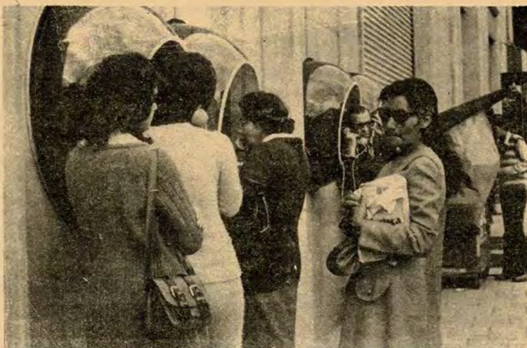
EL DRAMA DE TODOS LOS DIAS.

ca echar en la ranura una moneda de 50 centavos, "descalabrando" un tanto su bolsillo, puesto que los teléfonos también funcionan con más "centavos", y tienen sus resabios porque llenos tampoco funcionan. Por favor... Señores Directivos de la Empresa de Teléfonos de Bogotá: hagan algo por su ciudad y ayuden al que lo necesita, reparando los teléfonos que se encuentran situados en las principales vías de la capital para darle una buena imagen al turista que llega, y que se vea, la labor que cumplen los trabajadores que se desplazan por toda la ciudad en los carros de servicios de la Empresa de Teléfonos.