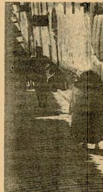
El conocido pregon "boteeellas, papeel..." que llega hasta los más apartados sitios de la ciudad, es el grito de las personas que con este trabajo buscan el sustento diario; la ganancia final no compensa la dura faena.

"La única solución para la empresa es, poseer una capacidad económica que le proporcione, comprar por mayor a las empresas de vidrios todo el envase que necesite. De esta manera se provoca inmediatamente otro problema, aún más grave, como es el desempleo y la situación que genera para las personas que en este momento se dedican a comprar botellas". Así se expresó el señor Yamid Saab.