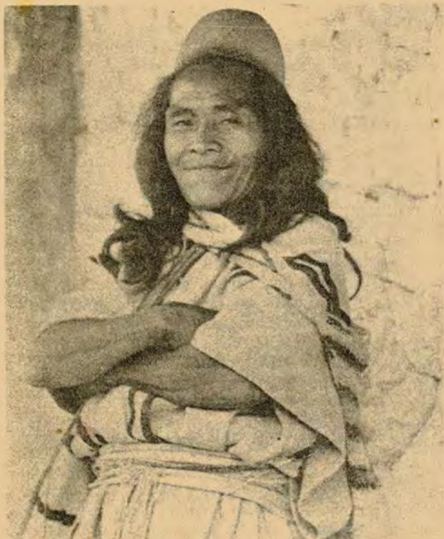
RESPONSABILIDAD DE LA SIERRA

Recae sobre los indígenas arhuacos quienes han sido encargados de cuidarla, porque alrededor de la Sierra está el origen y el sostén del mundo. De la forma en que protejan todo lo que allí hay, depende la existencia del mundo.