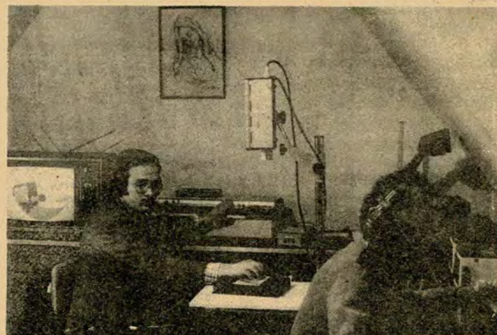
ANTES DE SALIR AL AIRE

Los alumnos del octavo semestre de ciencias de la Comunicación Social del INSE y los encargados de la parte técnica, se preparan para iniciar el noticiero de televisión "Últimos Sucesos", grabado diariamente en el estudio y con los equipos que la Institución posee.