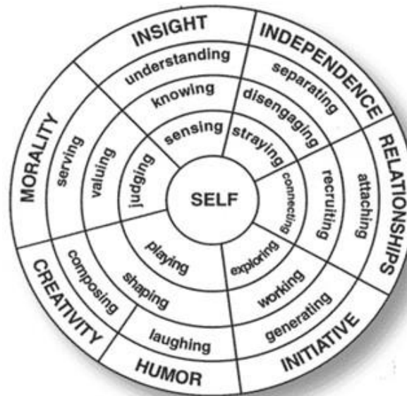
Figura 1. Arquetipo del desarrollo de la resiliencia de Wolin y Wolin.